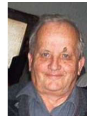
VII - VIII