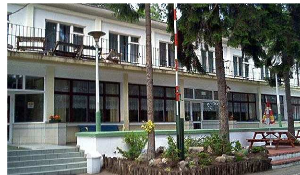
Leśny Dwór - budynek główny.